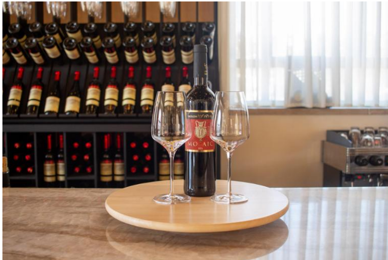
Besuch der Winzerei Shilo.