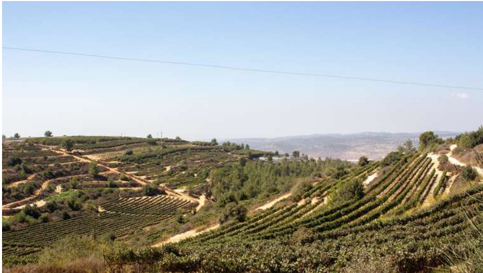
Die Weinberge von Gush Etzion, einem Siedlungsblock im besetzten Westjordanland.